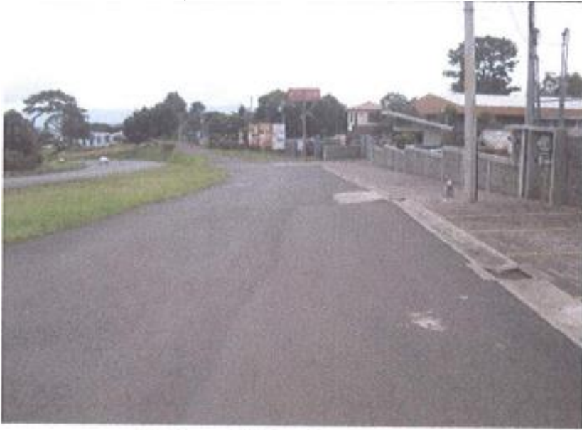
Calle pública de acceso