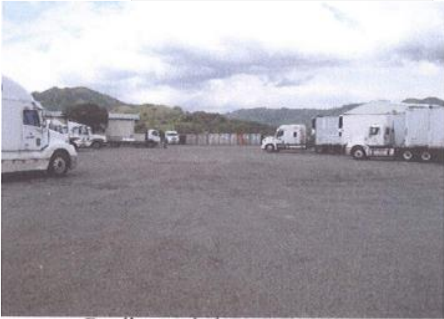
Predio en piedra